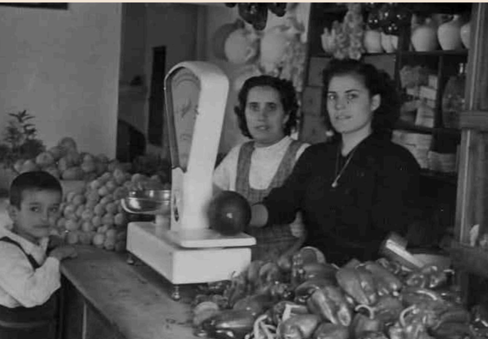
Tienda de comestibles