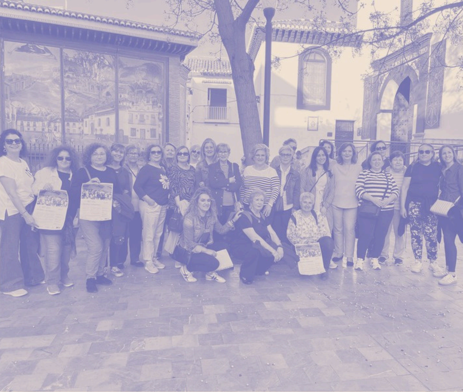
Maracena. Grupo motor