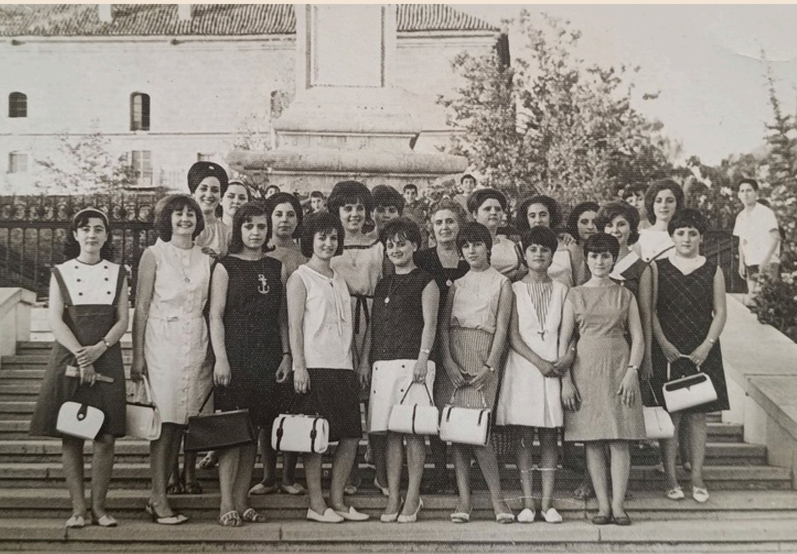
Las modistas