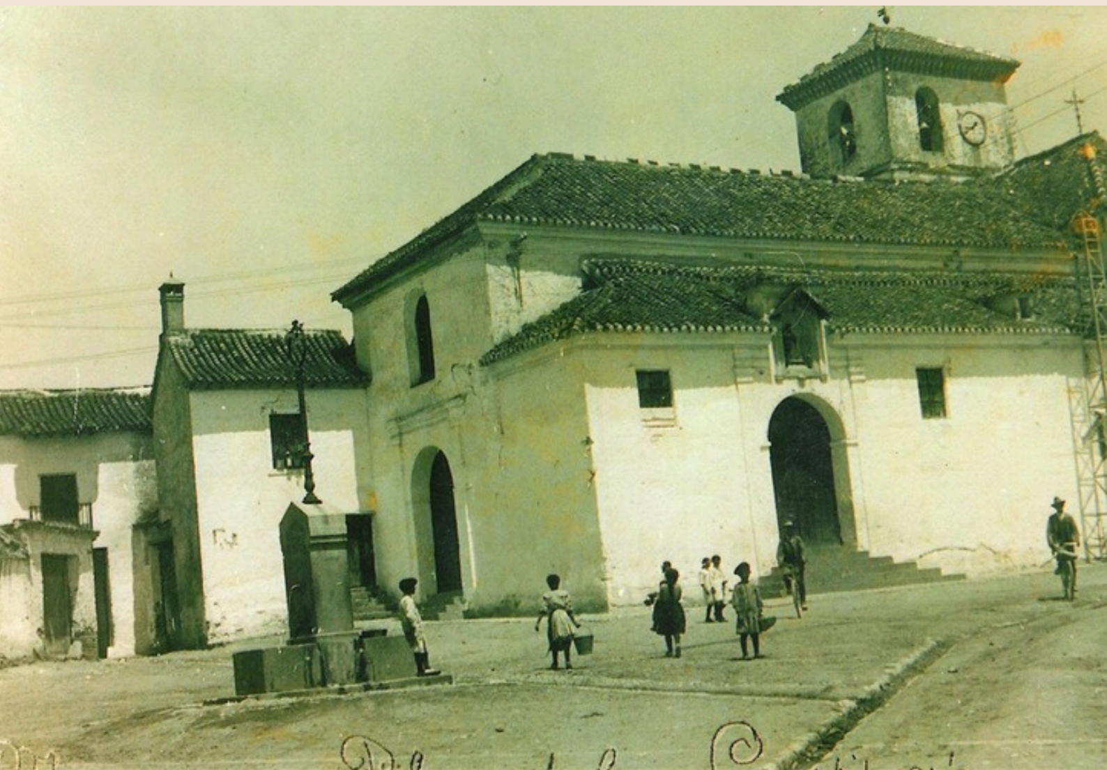
Placeta de misa