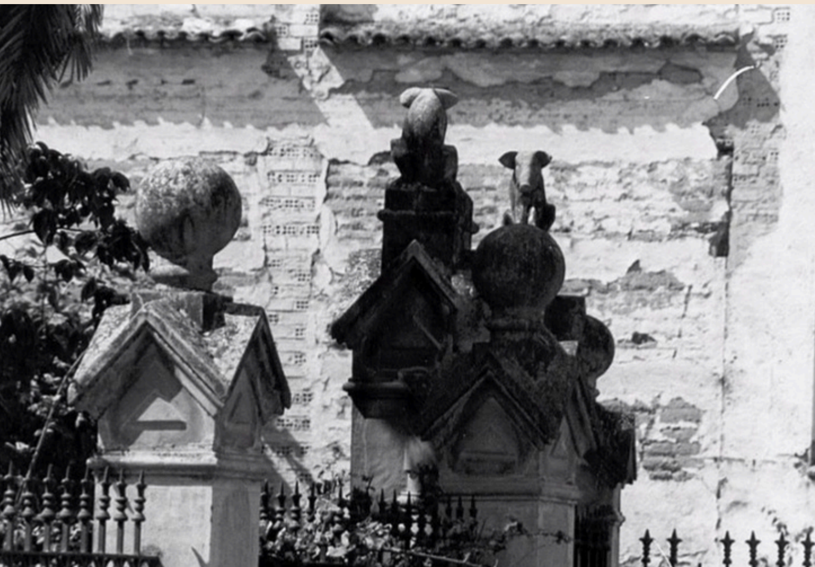
Marranillos de los Rojas