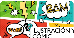
ILUSTRACIÓN Y CÓMIC